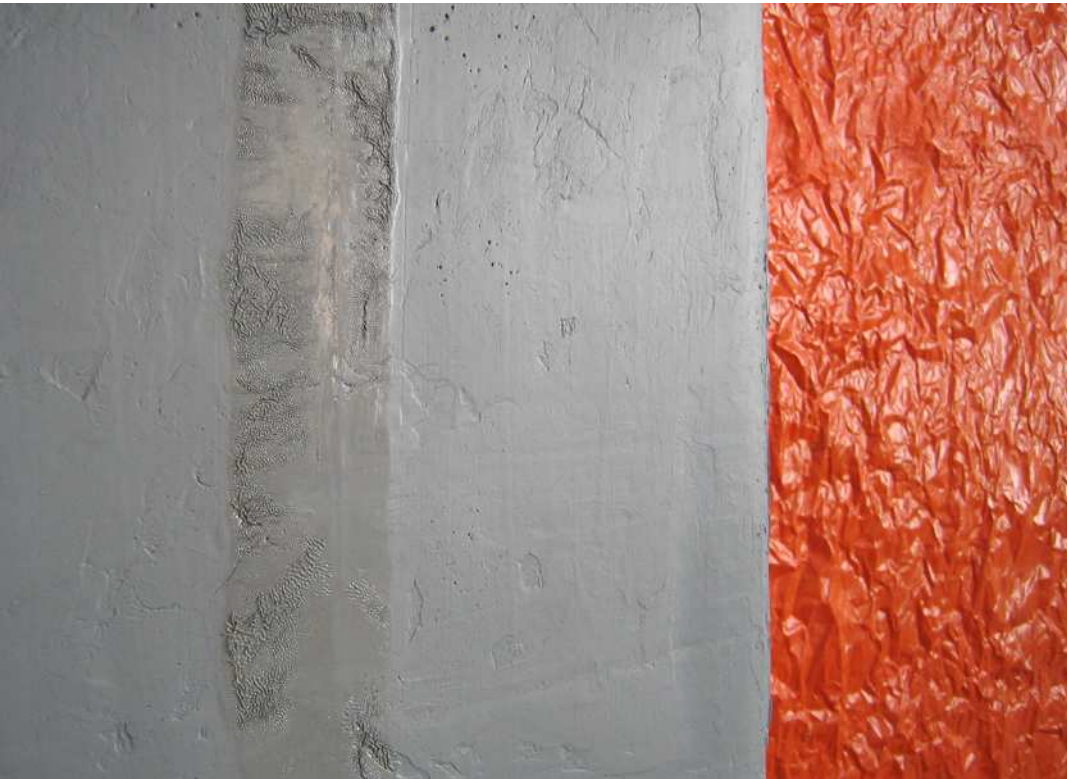
Pigment, Leinöl, Ölfarbe, Gouache, Pappkiste, Papier, Keilrahmen. 40 x 35 x 24,5 cm & 100 x 58,5 x 2,5 cm