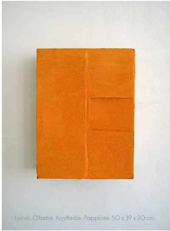
Leinöl, Ölfarbe, Acrylfarbe, Pappkiste, 50 x 39 x 20 cm