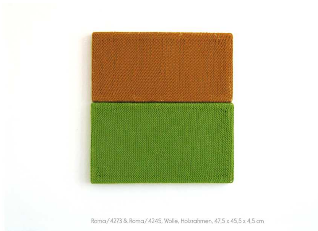
Roma/4273 & Roma/4245, Wolle, Holzrahmen, 47,5 x 45,5 x 4,5 cm