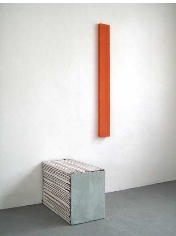
Pigment, Leinöl, Ölfarbe, Acrylbinder, Pappkiste, 41 x 32 x 62,5 cm Calypso/ 4974, Bändchengarn, Holzrahmen, 120 x 12,5 x 4,5 cm