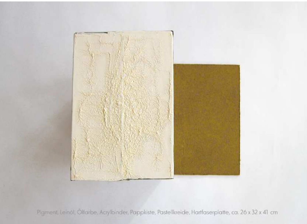
Pigment, Leinöl, Ölfarbe, Acrylbinder, Pappkiste, Pastellkreide, Hartfaserplatte, ca. 26 x 32 x 41 cm