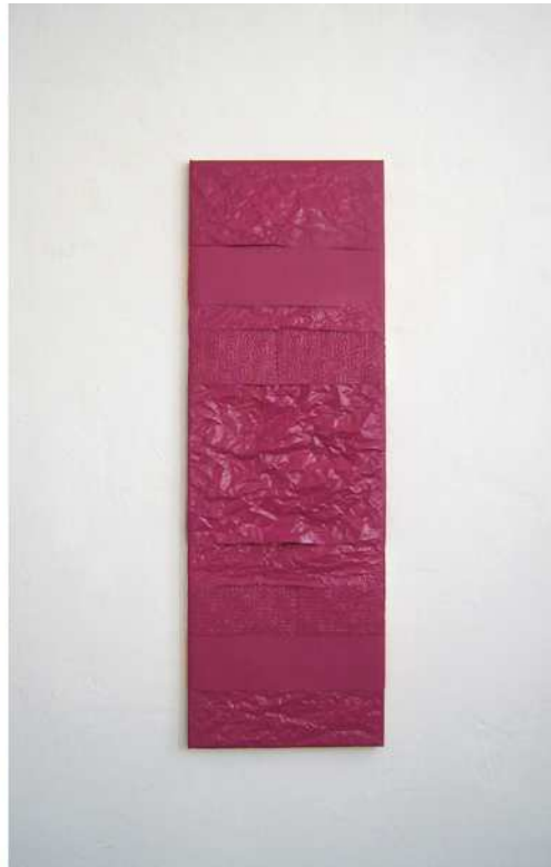
links: Leinöl, Ölfarbe, Papier, Küchenkrepp, Keilrahmen, 91 x 30 x 2,5 cm rechts: Pigment, Leinöl, Ölfarbe, Acrylbinder, Pappkiste, 40 x 35 x 24,5 cm