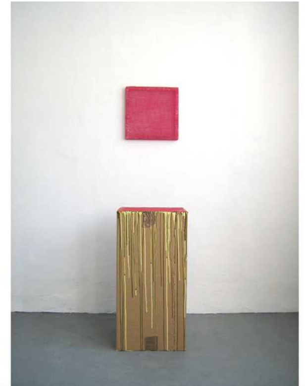
LericiFein/907, Walle, Holzrahmen, 37 x 37 x 4 cm Leinöl, Ölfarbe, Lack, Gouache, Papp- kiste, 70 x 40 x 39,5 cm