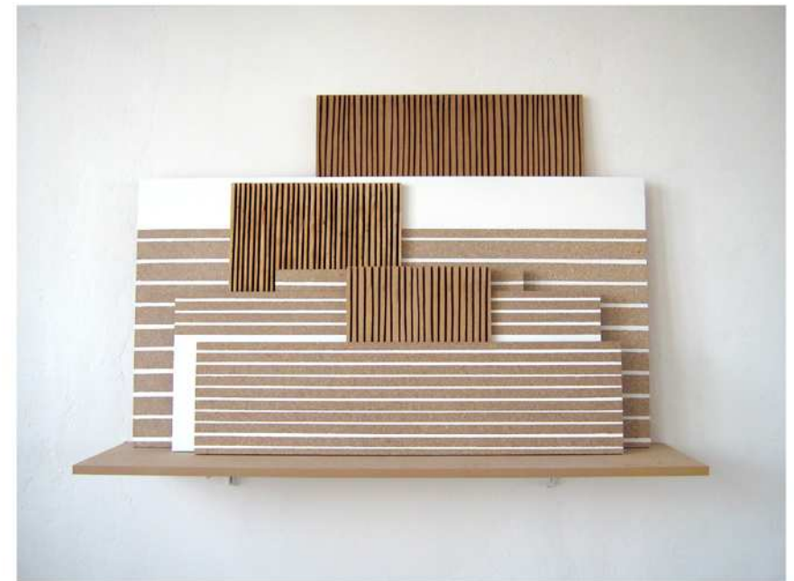
... Winkelschleiferzeichnungen in Multiplex- und MDF-Platten