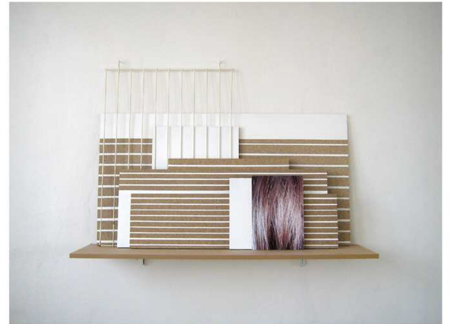
... Teil eines Wäscheständers, C-Print auf Fotopapier auf MDF